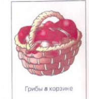
Грибы в корзине