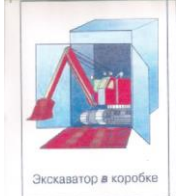
Экскаватор в коробке