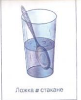
Ложка в стакане