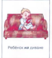
Ребёнок на диване