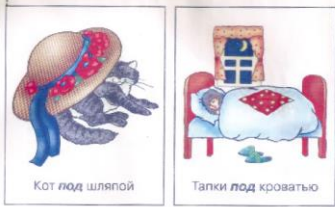
Кот под шляпой