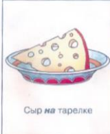
Сыр на тарелке