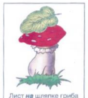
Лист на шляпке гриба