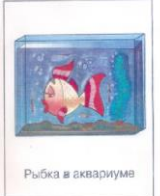
Рыбка в аквариуме