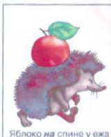
Яблоко на спине у ежа