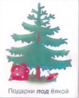
Подарки под ёлкой