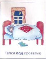
Тапки под кроватью