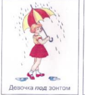
Девочка под зонтом